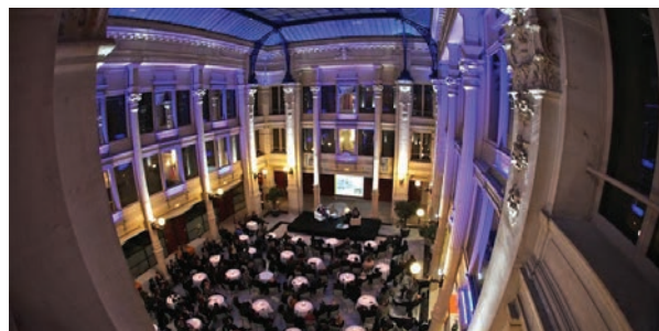
Grand Hall du Siège de la SMC et lieu d'accueil de nombreux événements régionaux.

• Participation à la 2 ème édition de « Bouge-toi l'entreprise » , événement phare de l'année organisé par le Medef Languedoc-Roussillon et Montpellier Sète Centre Hérault, qui a permis de réunir plus de 800 chefs d'entreprise régionaux autour d'ateliers thématiques et d'une plénière sur le thème « Le patron, ce héros des temps modernes ».