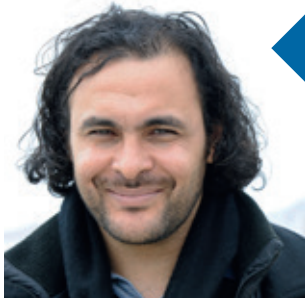
Kader Attia Artiste concepteur de l'œuvre "Les Terrasses" sur la Digue du large à Marseille

Par son engagement auprès de Marseille-Provence 2013 et son soutien du projet que j'ai conçu pour la Digue du large, la Société Marseillaise de Crédit s'inscrit dans une longue tradition de mécènes animés d'une volonté d'ouverture sur l'art et sur la cité.